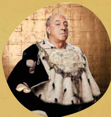
Ramon Fontserè El Rey Emérito